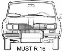
MUST R 16

5 ème Sortie RENAULT 16 européenne Alsace 2013 11 et 12 Mai